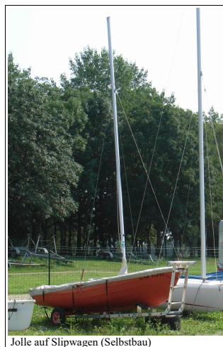
Jolle auf Slipwagen (Selbstbau)