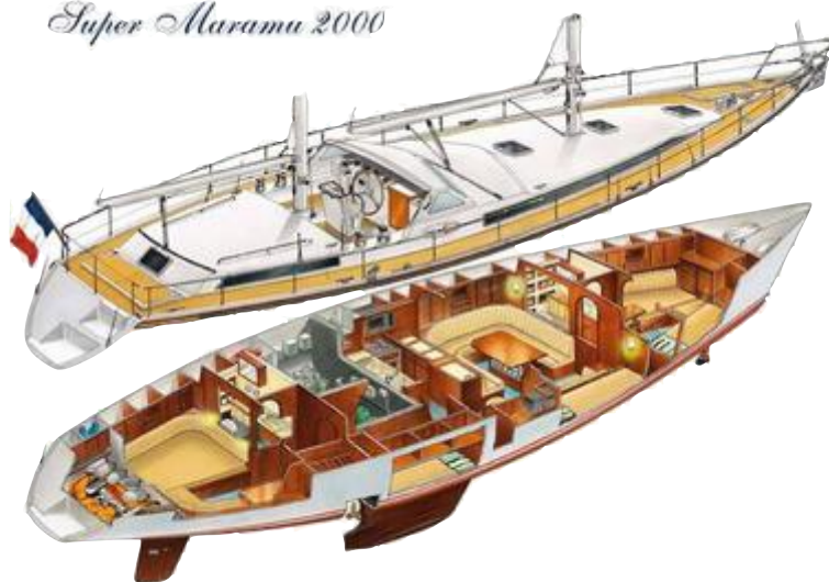
Super Maramu 2000